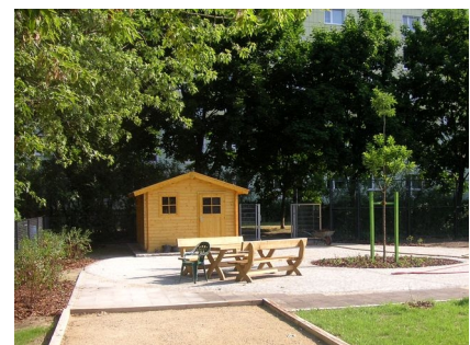
Das Gartenhaus mit Terrasse, Tisch und Bänken