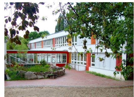
Innenhof der Kita