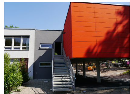
Der Übergang von der Kita zum neuen Familienzentrum FUN