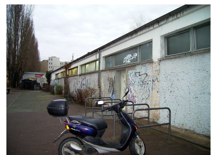
Das Funktionsgebäude vor dem Umbau