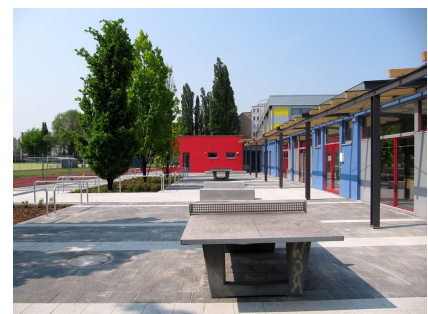
Der kleine Außenbereich des Familienzentrums mit Zugang zum Sportplatz