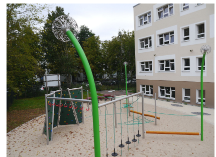
Kletter- und Balancierparcours mit dem Symbol der Schule