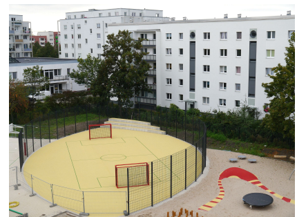
Bolzplatz mit Kunststoffboden und Ballfangzaun