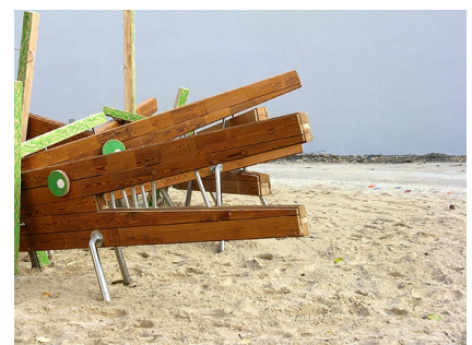
Eine Krokodilherde auf dem erneuerten Hortspielfeld