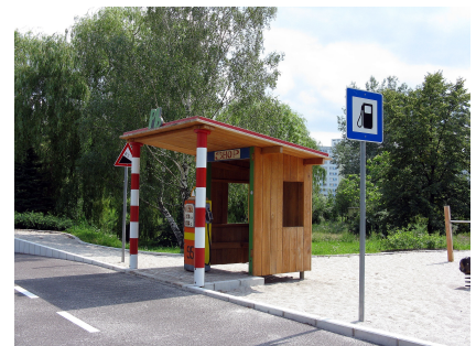
Der Verkehrsgarten entstand 2010 auf der Rückbaufläche eines Kindergartens