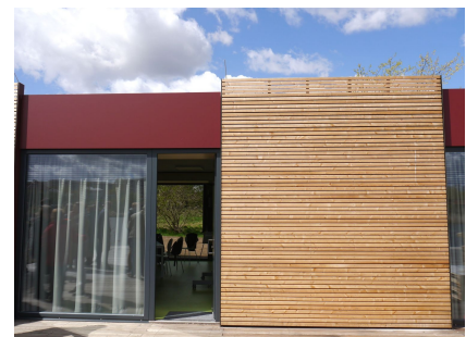
Die Lamellenfassade des Holzmodulbaus mit großen Fensterflächen