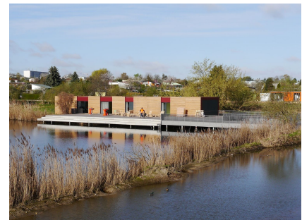
Blick über den Wuhleteich auf das Umweltbildungszentrum