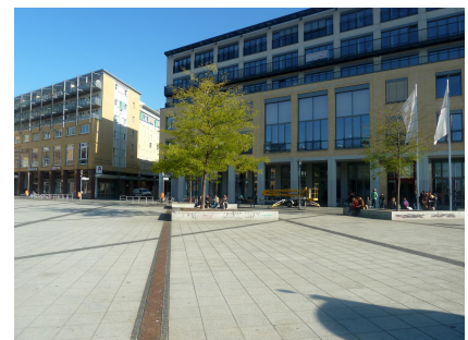
Blick über den Alice-Salomon-Platz auf die gleichnamige Hochschule