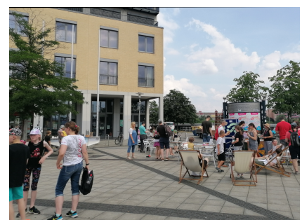
Ein Ort für Begegnungen und Feste