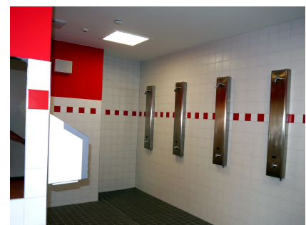
Moderne Sanitarräume im gleichen Farbspektrum