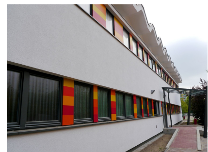
Barrierefrei und mit attraktiver Fassade