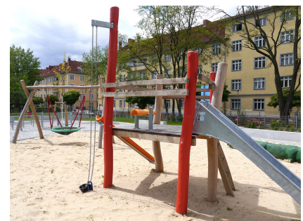
Der neue Kleinkinderspielplatz