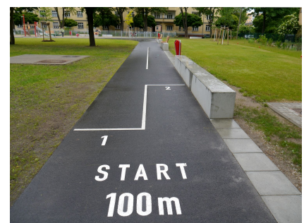
Eine Asphaltbahn führt um die Liegewiese