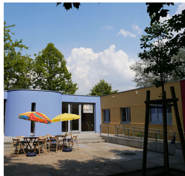
Eingang der neuen Kunst-Kita „ARTKI“