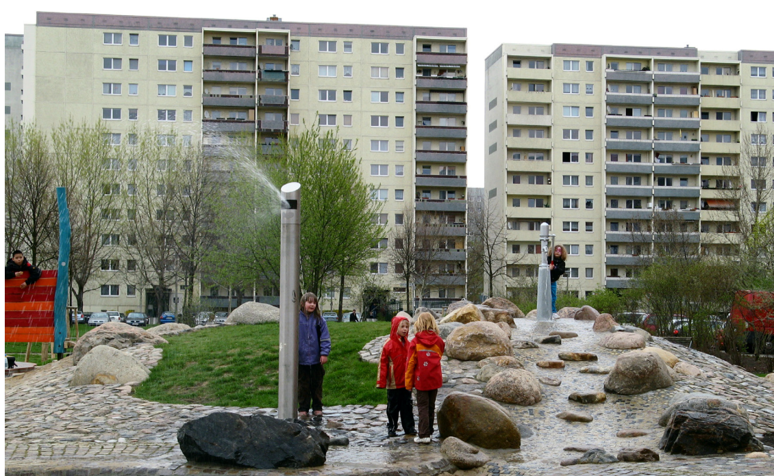
Quartierspark Warnitzer Bogen