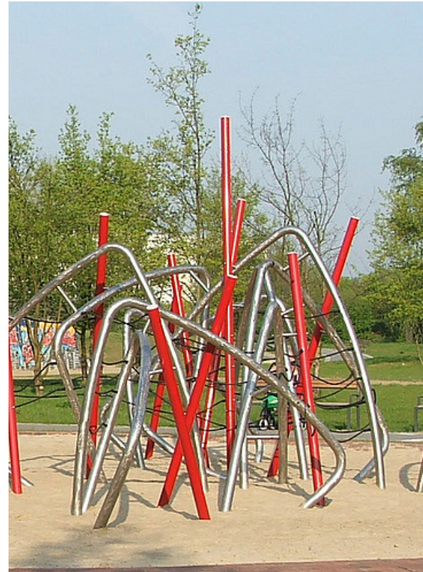
Quartierspark Neubrandenburger Straße

Der Rückbau zweier Schulen in Hohenschönhausen eröffnete für das Quartier an der Egon-Erwin-Kisch-Straße die Chance für einen attraktiven öffentlichen Freiraum. Mit intensiver Beteiligung der Bürgerschaft sowie hier ansässiger Vereine wurde die Vision eines Parks entwickelt, der verschiedenen Altersgruppen vielfältige Möglichkeiten für Spiel, Sport und Erholung bietet.