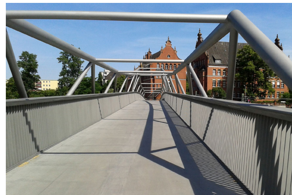
Alfred-Lion-Steg als Teil des Ost-West-Grünzuges