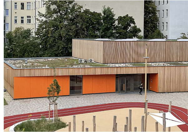
Neubau von Sporthalle, Laufbahn und Bewegungsparcours für die Johannes-Schule

Der Umbau der Ella-Barowsky-Straße verbessert die zentrale Quartiersachse der „Schöneberger Linse“. Es entstehen breitere Fußwege, eine separate Radfahrspur, neue Straßenlaternen und Bäume, um die Sicherheit und Aufenthaltsqualität zu erhöhen. Die erste Bauphase, die derzeit umgesetzt wird, betrifft den Abschnitt zwischen Hedwig-Dohm-Straße und Gotenstraße.