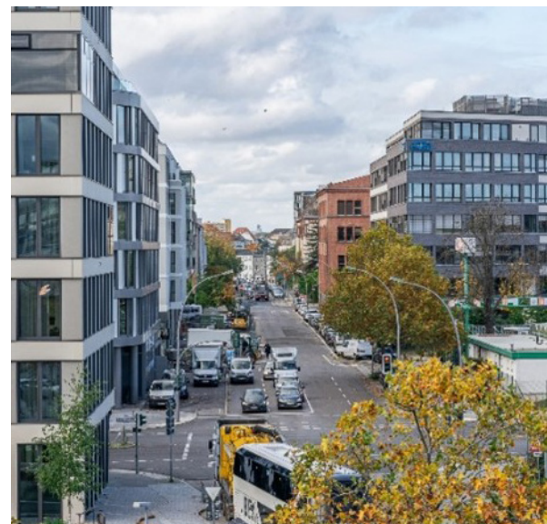
Blick von Osten in die Ella-Barowsky-Straße