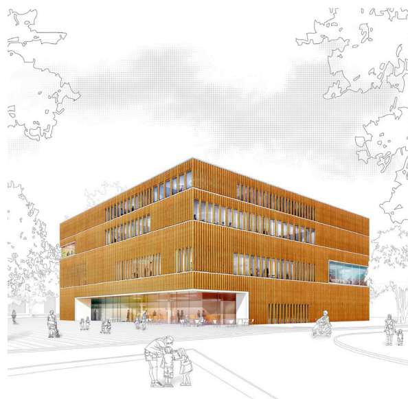
Entwurf BIZ © karlundp