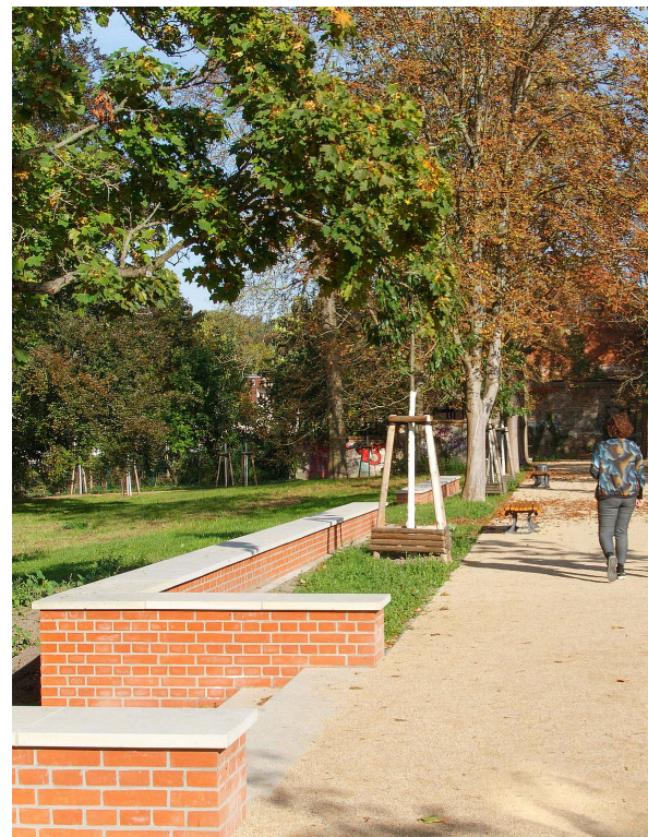
Erneuerte Wege und Treppen im Schlosspark

Mit dem Neubau eines Bildungs- und Integrationszentrums (BIZ) im Fördergebiet Buch sollen leicht zugängliche Angebote aus den Bereichen Musik, Sprache, Geschichte, bildende und darstellende Kunst, Sport und Naturwissenschaft an einem zentralen Ort an der Wiltbergstraße zusammengefasst werden. Das BIZ will alle Bevölkerungsgruppen ansprechen und die Integration von Geflüchteten unterstützen.