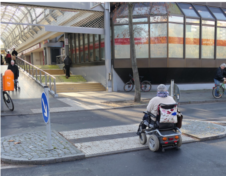
3 Die neue Mittelinsel mit taktilen Streifen verbessert seit 2021 den nördlichen Zugang zum Märkischen Zentrum.