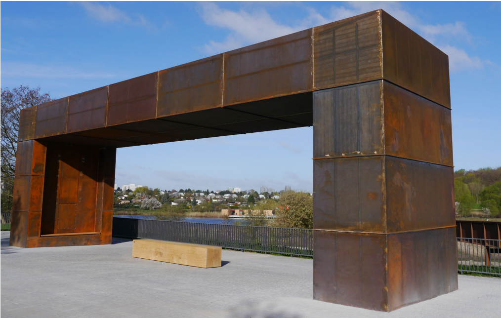
1 Das „Hellersdorfer Fenster“ am Eingang zum Wuhletal wurde zur IGA 2017 geschaffen und markiert den besonderen Ort sehr prägnant.