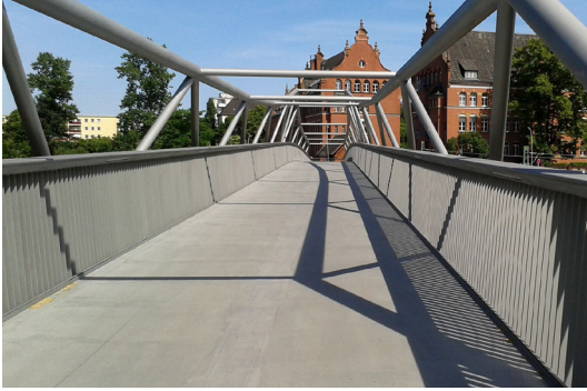
5 Der neue Alfred-Lion-Steg bildet das Kernstück eines Ost-West-Grünzuges und ermöglicht seit 2012 eine neue Verbindung zwischen Tempelhof und Schöneberg. © Anka Stahl