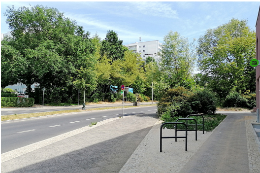
4 Die 2022 sanierte Fußgängerpromenade führt von der Walter-Friedrich-Straße bis zur Groscurthstraße zum geplanten Bildungs- und Integrationszentrum in Buch.