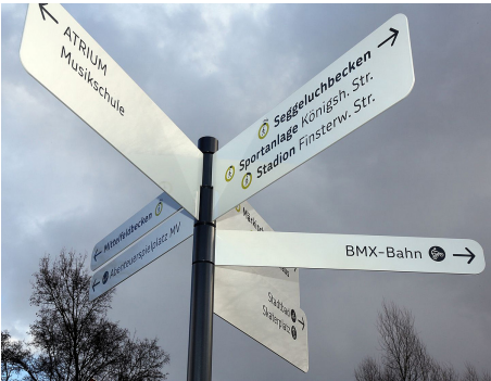
2 Zur besseren Orientierung dienen seit 2016 Richtungsweiser des neuen Leit- und Infosystems im Märkischen Viertel