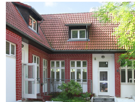
2 Das Familienzentrum am Heckerdamm ist jetzt in einem ehemaligen Gebäude des Grünflächenamtes untergebracht, das 2017 für die neue Nutzung umgebaut wurde.