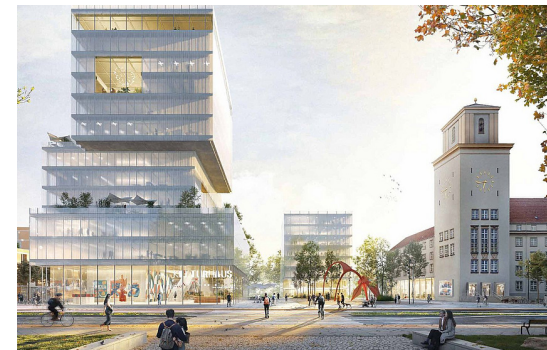
4 Perspektive: Blick auf den Tempelhofer Platz mit Rathaus, Rathäuserweiterung und dem neuen Kultur- und Bildungsbaustein

© TeleInternetCafe mit Treibhaus Landschaftsarchitektur Hamburg (Visualisierung Jonas Bloch)