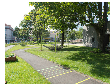
3 Weitläufige Sport- und Spielflächen, Platz zum Gärtnern und Erholen in der Kinder- und Jugendfreizeiteinrichtung Gotlindestraße im Fördergebiet Frankfurter Allee Nord

© TeleInternetCafe mit Treibhaus Landschaftsarchitektur Hamburg (Visualisierung Jonas Bloch)