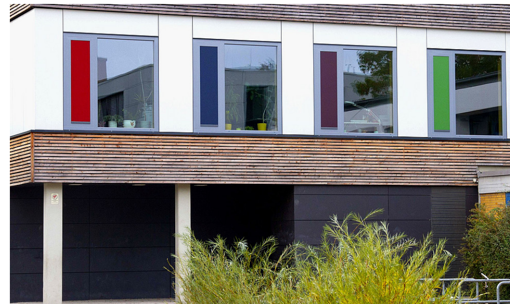
1 Die ehemalige Bibliothek in der Westendstraße wurde zu einem Beratungsgebäude für den Kinder- und Jugendgesundheitsdienst sowie den Regionalen Sozialen Dienst umgebaut.