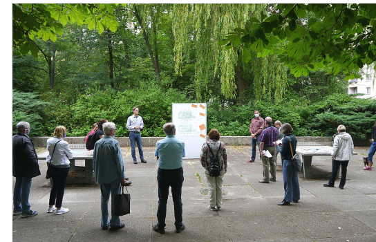
4 Die Beteiligung der Bürgerschaft findet oftmals zur Konzeptphase statt – wie hier für den Mehrgenerationenplatz „Drei Grazien“ im Fördergebiet Greifswalder Straße.