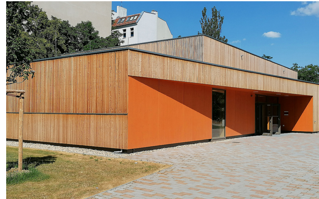
1 Die neue Sporthalle der Johannes-Schule mit extensiver Dachbegrünung und unbehandelter Lärchenholzfassade reiht sich harmonisch in den Gesamtkomplex des Campus ein.