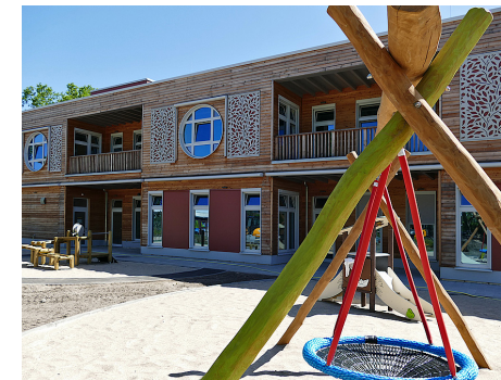
2 Für die Kita Havelländer Ring dienen Holz und Schafswolle als Bau- bzw. Dämmmaterialien. Das Dach wurde als Gründach konzipiert. Neben Fernwärme kommt eine Photovoltaik-Anlage für die Energiegewinnung zum Einsatz.