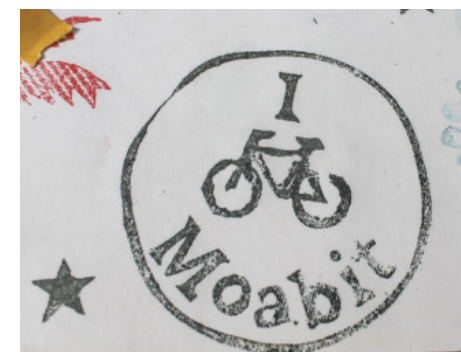
3 Die Verbesserung der Bedingungen für den Radverkehr innerhalb der Quartiere ist ein wichtiger Beitrag zur Klimaanpassung.