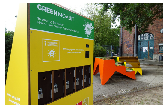
5 Solarhub auf dem Grundstück der Heinrich-von-Stephan-Gemeinschaftsschule in Moabit