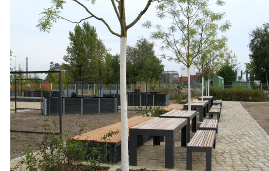
4 Der Stadtgarten Moabit wurde 2007 bis 2012 zu einer vielfältig nutzbaren Grünanlage umgebaut.