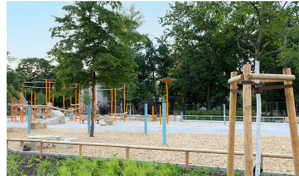
1 Der neue Spielplatz Halemweg ist eingebunden in die Grünverbindung Halemweg-Popitzweg, die unter dem Motto „Grün ohne Grenzen“ umgeplant wird.