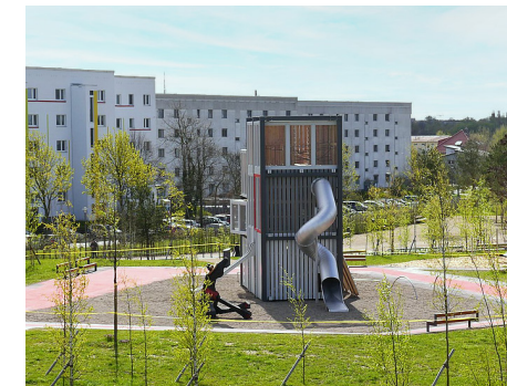
2 IGA elektropolis, Marzahn-Hellersdorf