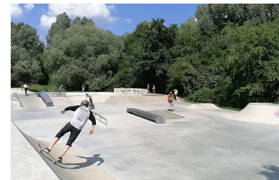
5 Im Juni 2020 wurde die qualifizierte Skateranlage in der Wolfgang-Hein-Straße in Buch fertiggestellt und zur Nutzung frei gegeben.