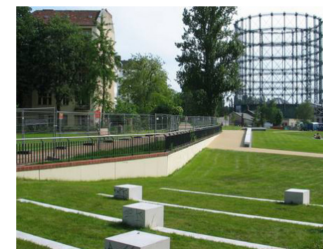
3 Der neugeschaffene Park „GASAG Nordspitze“ ist Teil des Grünzugs der sogenannten Schöneberger Schleife. Er wurde 2009 fertiggestellt.