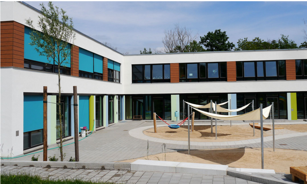
1 Neubau der „Kita Kiesteich-Surfer“: Im Falkenhagener Feld fehlten rund 590 Kita-Plätze. Auf einem Teilstück des Parkplatzes am Spektepark wurde deshalb eine Kita mit 119 Plätzen neu errichtet, davon 40 Krippenplätze für Kinder unter drei Jahren.