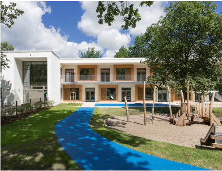
2 Der Neubau der Kita „Regenbogen“ am Senftenberger Ring, 2017 fertiggestellt, besticht durch ansprechende Architektur und hohe Funktionalität. © STARK + STILB ARCHITEKTEN