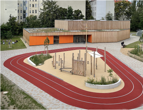
3 Neubau einer Sporthalle für die Johannes-Schule Berlin: Die Einfeldsporthalle wurde wie alle Gebäude des Campus in Holzbauweise errichtet und erhielt eine extensive Dachbegrünung.