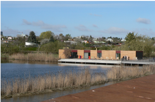
5 2017 ist am Wuhleteich der Neubau eines Umweltbildungszentrums entstanden, das als attraktiver und anregender Bildungsort für Umweltthemen allen Interessierten offen steht.