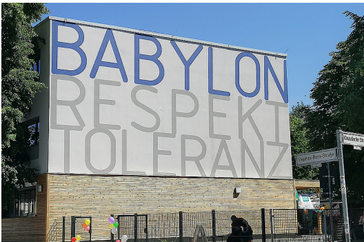
4 Das Haus Babylon ist eine interkulturelle Begegnungsstätte des Trägers Babel e.V. - Name und Motto des Hauses sind nach dem Umbau und der energetischen Sanierung weithin sichtbar.