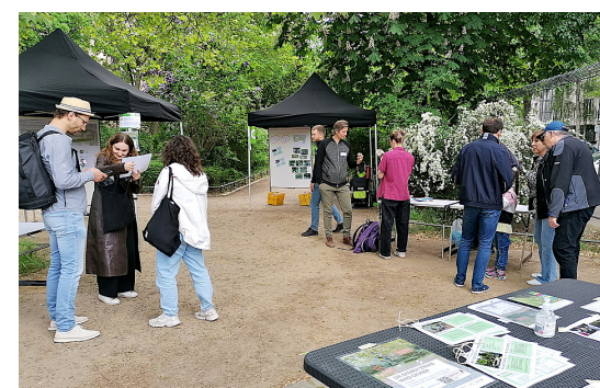
5 Information und Diskussion mit Interessierten bei der Vorstellung der Pläne zur Umgestaltung des Nahraums Bremer Straße im Fördergebiet Tiergarten-Nordring/Heidestraße