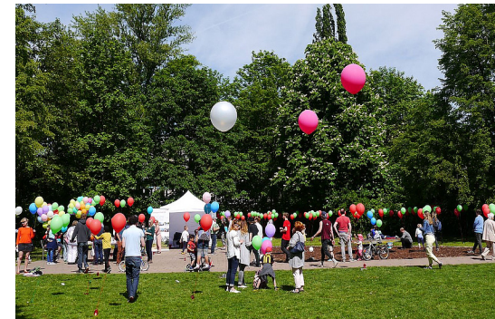
4 Planungsparty zum Tag der Städtebauförderung 2018 im Einsteinpark im Fördergebiet Greifswalder Straße