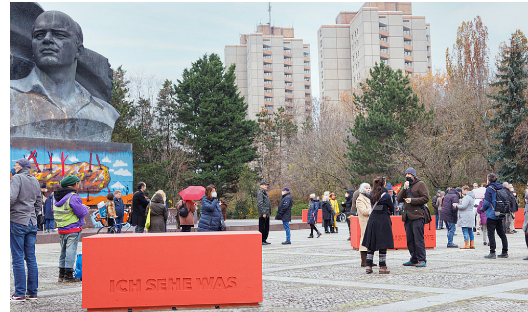
1 Ernst-Thälmann-Denkmal mit künstlerischer Kommentierung am Tag der Enthüllung