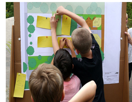
2 Jugendbeteiligung bei der Planungsparty für den Jugendspielplatz in der Theodor-Brusch-Straße in Buch