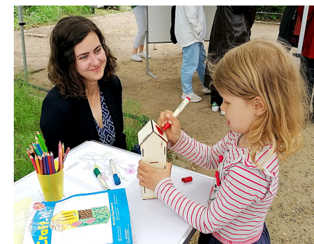
3 Die Bastelaktion am Tag der Städtebauförderung rückte den ökologischen und den pädagogischen Wert von urbanen Grünflächen in den Mittelpunkt (Fördergebiet Tiergarten-Nordring/ Heidestraße)