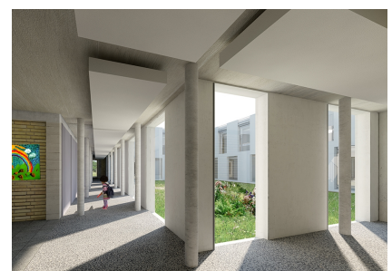
Visualisierung: Blick in den Innenhof nach der Neugestaltung