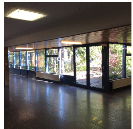
Blick aus dem Schulgebäude in den Innenhof