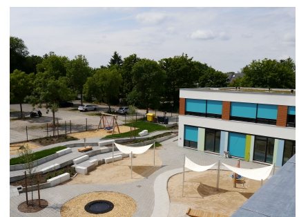
Blick vom Gründach auf die Freifläche