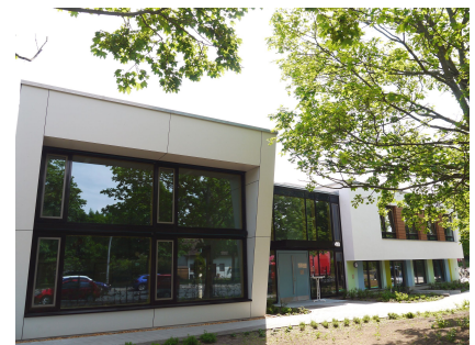
Die Kita verfügt über eine Bewegungshalle über zwei Geschosse